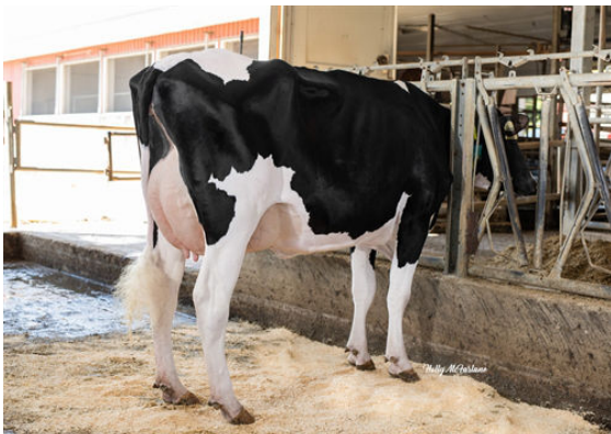
PROGENESIS GUARANT MILLIONS