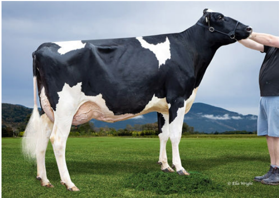
PEAK GUARANTEE NOBLE