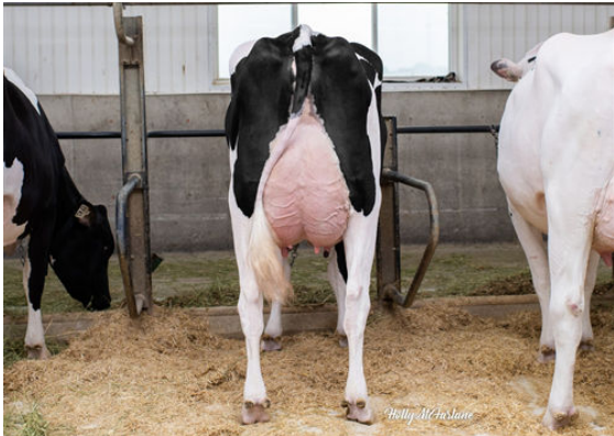
CLAYNOOK CLOVER GUARANTEE